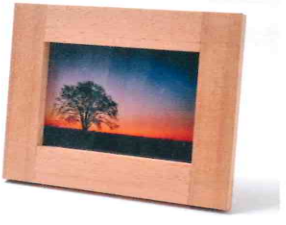
[ Level3 : フォトフレーム ]

1951年東京都生まれ。 28才の時9mクルージングヨットの自作開始→33才で完成・進水。この事が木工研究の 出発点。 著書に「超画期的木工テクニック集」(スタジオタッククリエイティブ)／「杉田式ノコギリ木 工のすべて」(オーム社)／「トリマーの究極活用術」(グラフィック社)など。